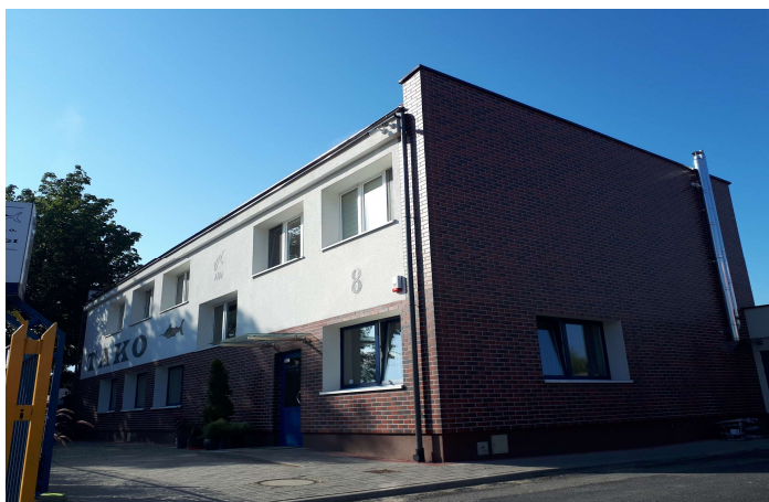
TAKO Armatura Rurociągi Sp. z o.o. ul. Pełczyńska 8 51-180 Wrocław

Godziny otwarcia: od poniedziałku do piątku 7:00 - 15:00