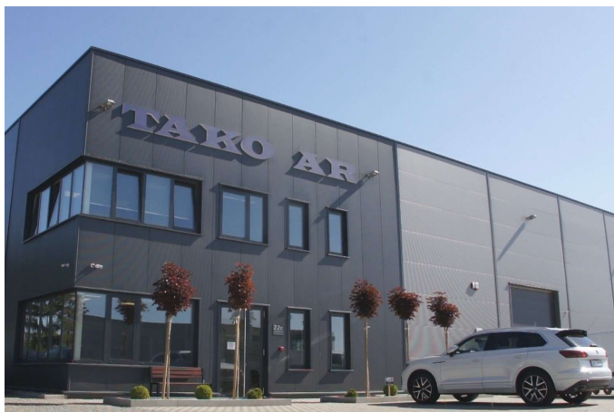
Oddział Poznań ul. Poznańska 22C 62-080 Tarnowo Podgórne

tel: + 48 71 372 68 50 e-mail: biuro@tako-ar.eu